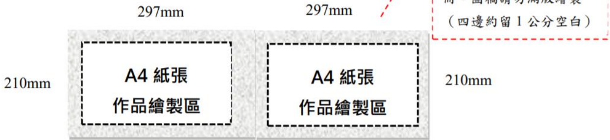
圖 2 作品紙張規格示意圖 (1 組 = 兩頁)