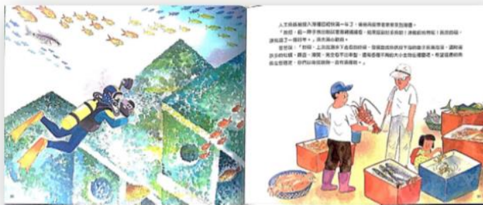
—範例作品引用自：爸爸是海洋魚類生態學家·張東君—